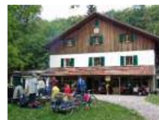
Das Buchberghaus seit 1913