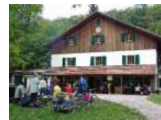
Das Buchberghaus seit 1913