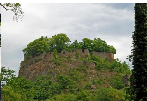
Burgruine Hohen Krähen