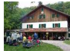
Das Buchberghaus seit 1913