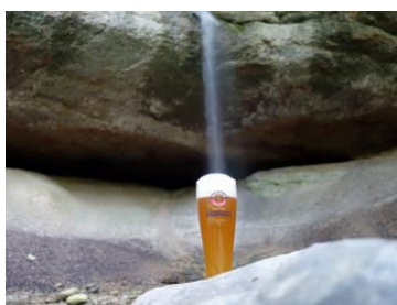
Wissengubel, 10 Minuten vor dem Tagesziel Gibswil

Ein vorgesehener Schlußstrunk fällt wegen vorübergehender Schliessung des Restaurants aus.