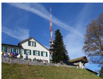
Höchster Punkt (Bachtel)

Aufstieg: 560 m, Abstieg 420 m Wanderzeit: 3 ½ Std.