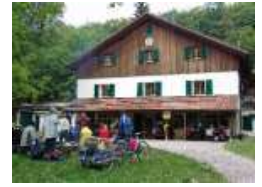
Das Buchberghaus seit 1913