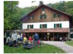
Das Buchberghaus seit 1913