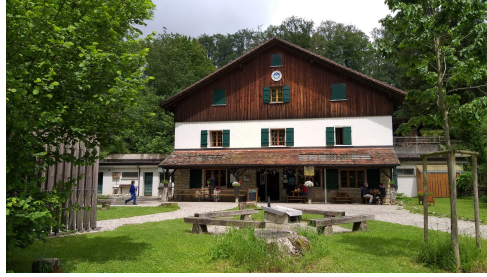
Das Buchberghaus seit 1913 707 m.ü.M.

Wir können in diesem Jahr die Metzgete mit dem obligatorischen Zertifikat plus Ausweis im Innenbereich wieder durchführen.