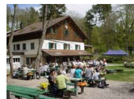
Das Buchberghaus seit 1913