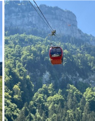
Talfahrt nach Brülisau

Die Wanderung beginnt in Brülisau bei der Bus-Haltestelle am Fusse der Hohen Kasten-Seilbahn. Der 1. Aufstieg mit 350 Hm führt uns zum Berggasthaus Ruhesitz. Beim dortigen Trink- oder Kaffeehalt erwarten uns rundum wunderbare Ausblicke. Weiter geht es nun leicht auf- und abwärts, vorbei an der Alp Soll Richtung Sämtisersee zum Restaurant Plattenbödeli. Die Mittagspause kann beim Picknicken oder im schönen Restaurant genossen werden. Anschl. geht es vorbei am Sämtisersee sowie leicht aufwärts zu den Alpwirtschaften Streckwees und zum 2. Aufstieg, der uns zur Alp Sigel führt. Sobald wir aus dem bewaldeten Abschnitt herauskommen, eröffnen sich uns einmalige Aussichten in die umliegende Bergwelt. An verschiedenen Alphütten vorbei gelangen wir zur Seilbahn, welche eine Höhendifferenz von 657 M überwindet und zum Abschluss nochmals spektakuläre Berg- und Talsichten bietet. Zurück in Brülisau wartet der Gasthof Rössli, um uns für die bevorstehende Heimfahrt zu stärken.