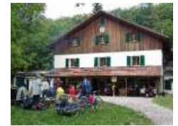
Das Buchberghaus seit 1913