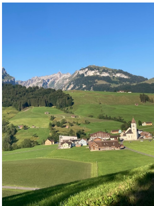
Brülisau und Alp Sigel

Diese fantastische Bergwanderung im Herzen des Alpsteins weist eine Länge von 10 km auf. Die 870 Höhenmeter führen über jeweils 2 Aufstiege von etwa 1 Stunde. Einige einfache Abwärtsmeter, max. 200 m, sind zu überwinden, aber einen eigentlichen Abstieg gibt es nicht. Dieser wird zum Abschluss der Wanderung mit der modernen Alp-Seilbahn der Alp Sigel in luftiger Höhe vollzogen.