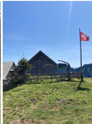
Alp Sigel: Hasenplattenhütte