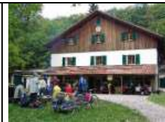
Das Buchberghaus seit 1913

Sonntag, 13. August 2023 (Schönwettertour)