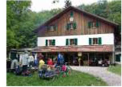
Das Buchberghaus seit 1913