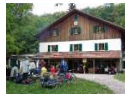
Das Buchberghaus seit 1913