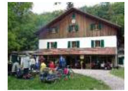
Das Buchberghaus seit 1913