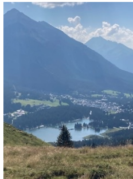
Heidsee von oben