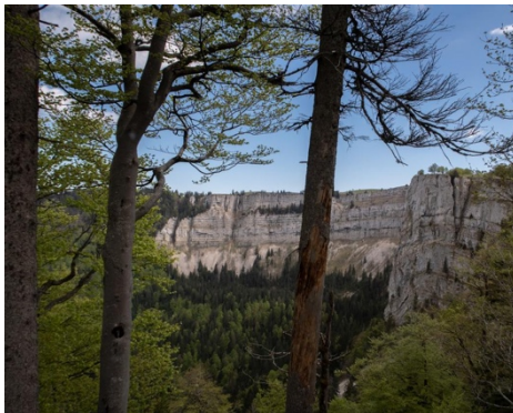
Creux du Van

De Tour beginnt im 500-Seelen-Dörfchen Noiraigue. Der Creux du Van ist eine natürliche Felsarena welche auf der Grenze der Kantone Neuenburg und Waadt liegt. Sie ist ungefähr 1200 Meter breit, und die senkrechten Felswände haben eine Höhe von rund 160 Metern. Nach dem Start leitet der Weg zum Bauernhof Les Oeuillons, ein willkommener Halt vor dem Aufstieg auf dem «Sentier des 14 Contours», also die 14 Kehren hinauf. Bei der Alphütte und dem Restaurant Le Soliat befindet sich der höchsten Punkt mit 1380 m ü. M, wo die Pause zum Mittagessen geplant ist. Die Wanderung führt anschliessend entlang den «sicheren» Abgründen des Creux du Van , bis zum Hof La Grand Vy und weiter abwärts Richtung Pré au Favre . Hier wird der Weg steiniger und steiler abfallend und bei der Ferme Robert gibt es vielleicht noch eine Gelegenheit zum Einkehren, um danach die letzten 2.5 Km der eindrücklichen Wanderung zu begehen.