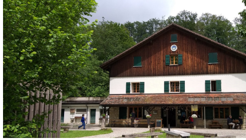
Das Buchberghaus seit 1913 707 m.ü.M.

Wir freuen uns, am Freitag, 25. Oktober 2024 um 12.00 Uhr und Abends ab 18.00 Uhr, am Samstagmittag 26. Oktober 2024 um 12.00 Uhr und Abends ab 18.00 Uhr auf dem Buchberg wieder eine feine