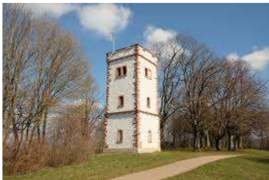
Aussichtsturm Hohe Flum