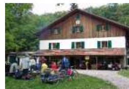
Das Buchberghaus seit 1913