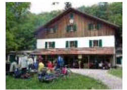
Das Buchberghaus seit 1913

Fritz Stucki, Stauffacherstrasse 18, 8200 Schaffhausen, Tel. 052 625 00 18 / 079 675 49 14, fristu@bluewin.ch