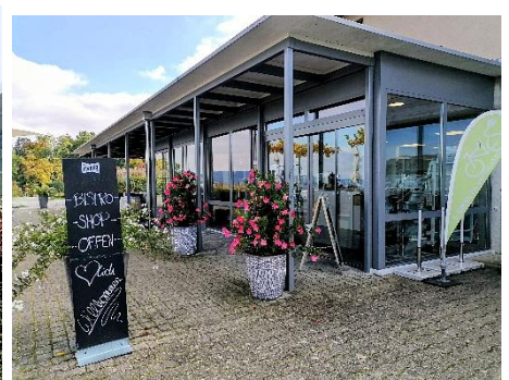
Aussicht vom Hüttenberg nach Stein am Rhein / Rhein bei Hemishofen / Das Bistro