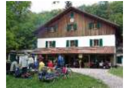
Das Buchberghaus seit 1913